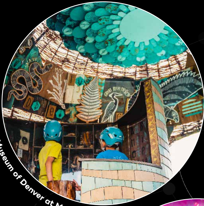
Children's Museum of Denver at Marsico Campus