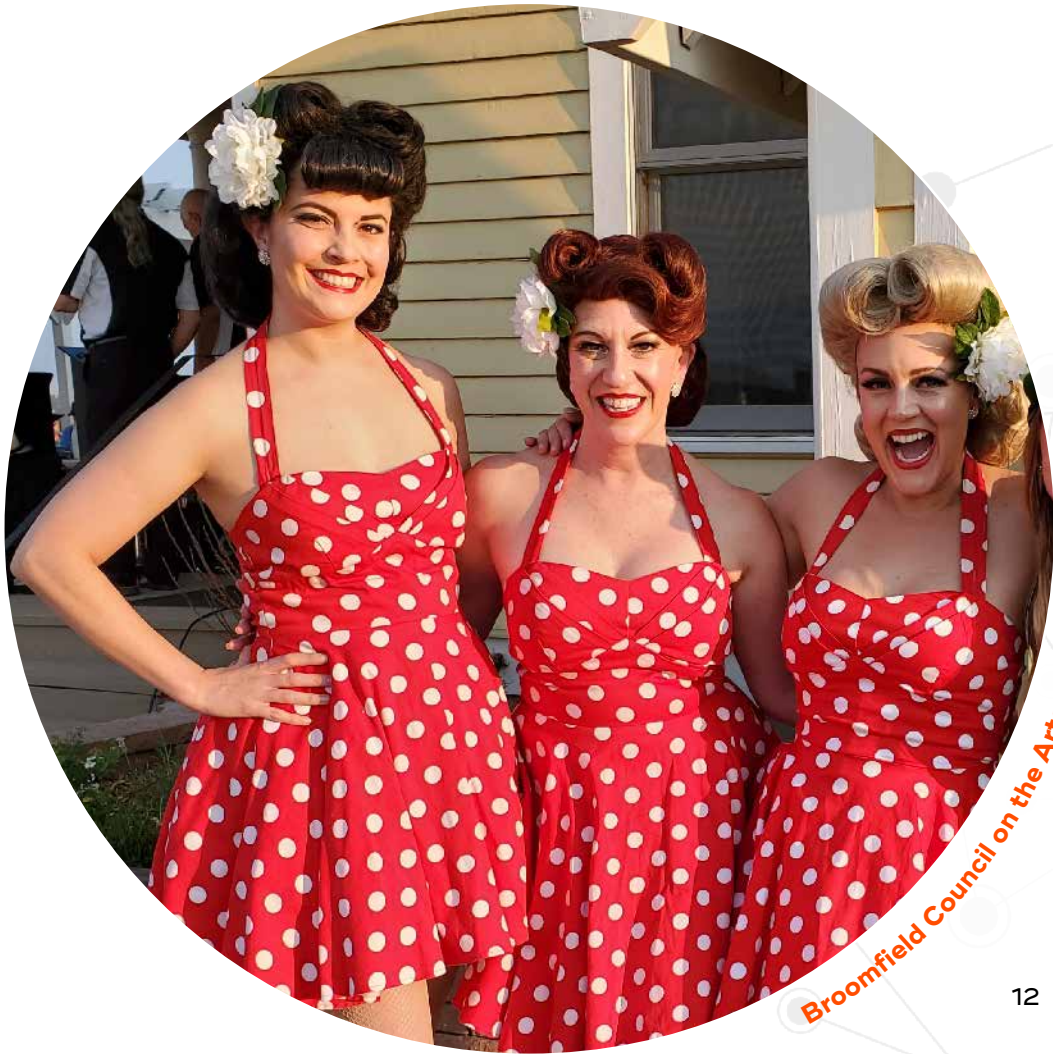
Broomfield Council on the Arts and Humanities