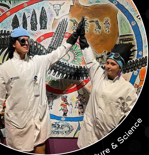
Denver Museum of Nature & Science