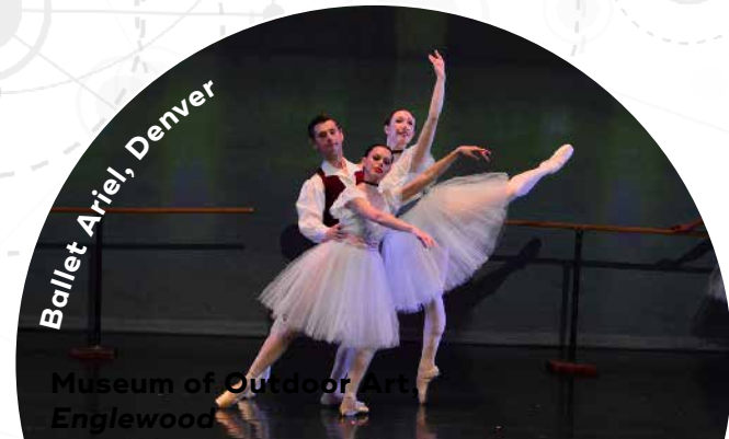
Ballet Ariel, Denver