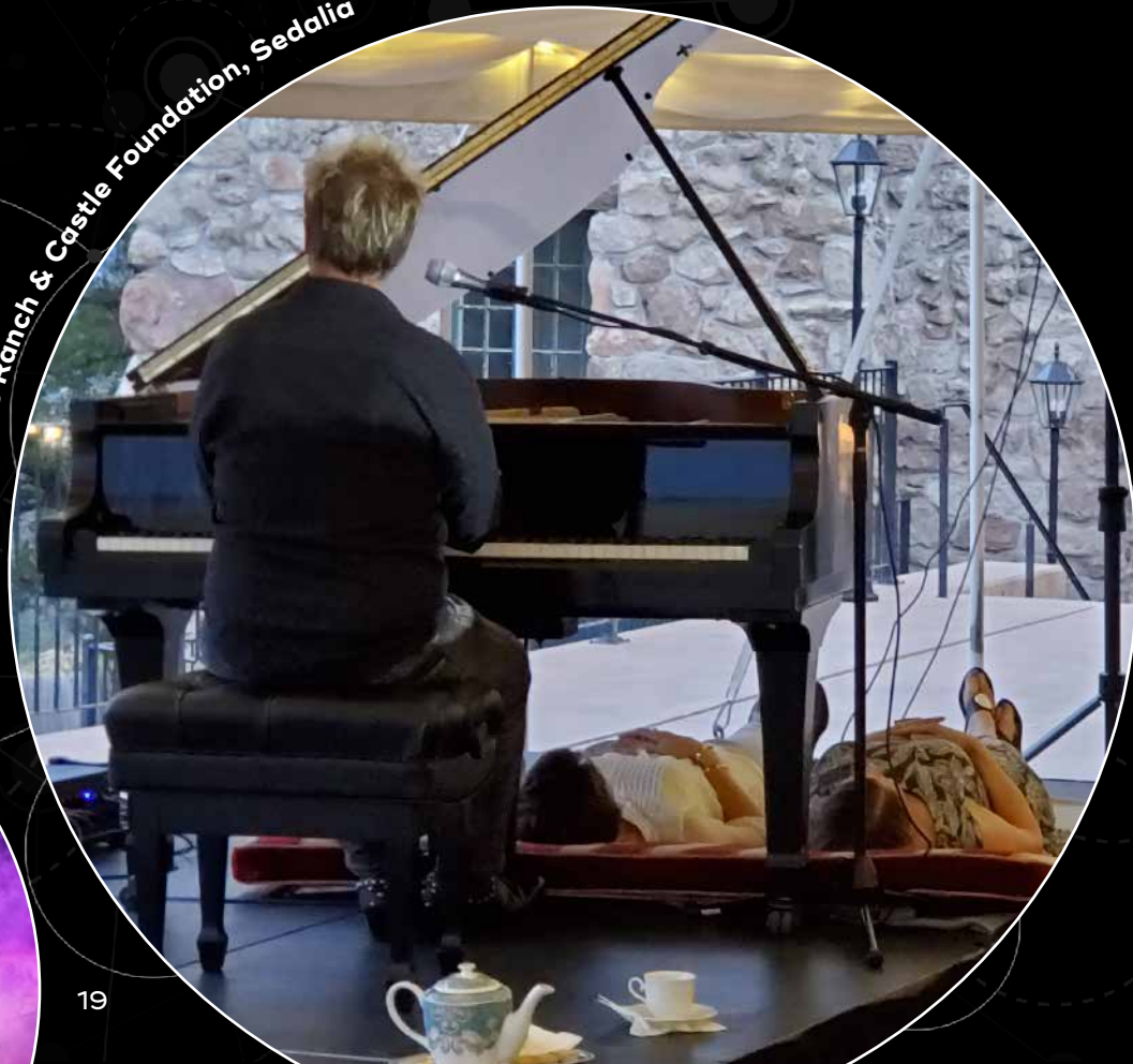
Cherokee Ranch & Castle Foundation, Sedalia