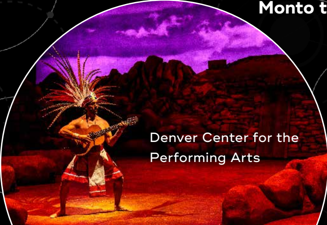
Denver Center for the Performing Arts