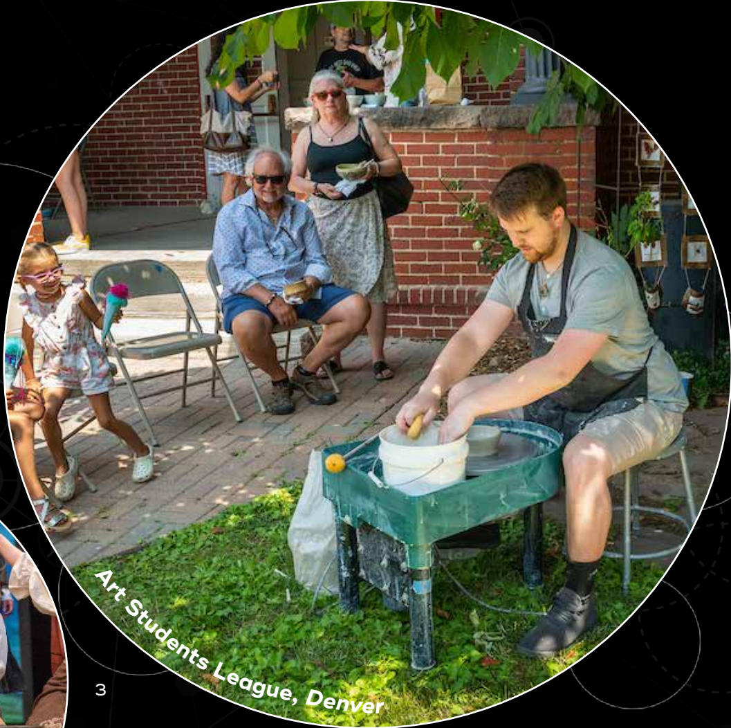
Art Students League, Denver