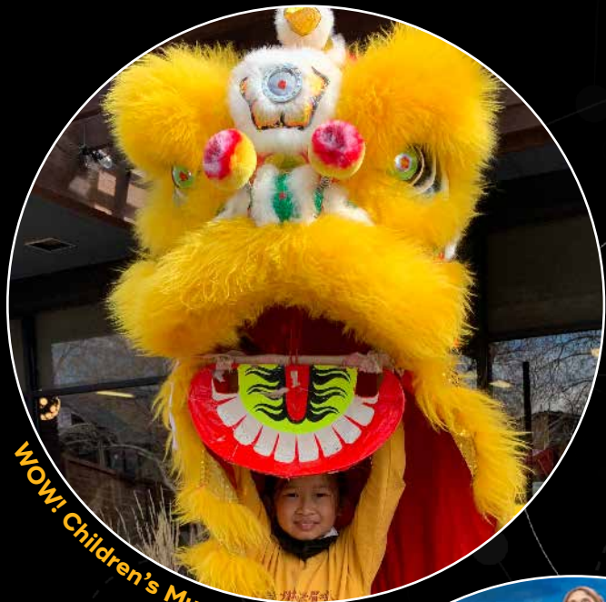
WOW! Children's Museum, Lafayette