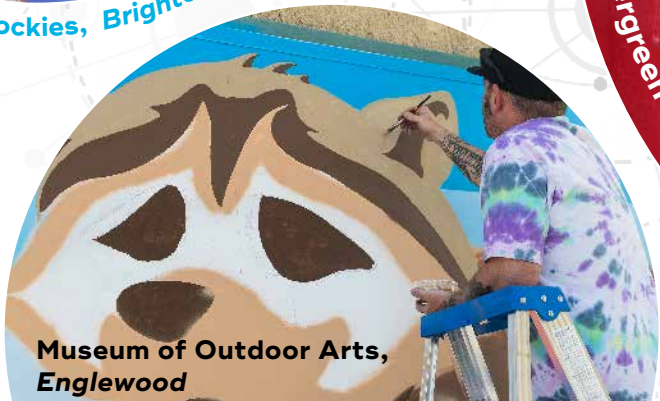
Museum of Outdoor Arts, Englewood