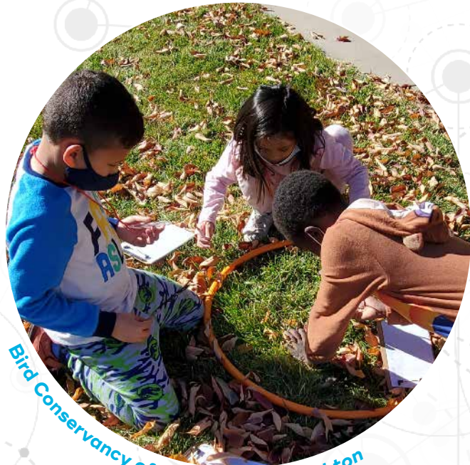
Bird Conservancy of the Rockies, Brighton